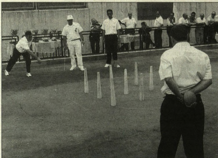
El club de bolos leonés nació hace 37 años

E L juego de los bolos, del cual existen referencias en tiempos de los faraones de Egipto, en la Grecia Clásica o en la América Precolombina, tiene una de sus representaciones en Bilbao por medio del club de bolo leonés "Virgen del Camino" a través de la sección de deportes del Hogar Leonés que lleva asentado en la Villa desde hace prácticamente setenta años y que también promociona la "lucha leonesa". El club de bolos "Virgen del Camino" (Patrona de León) comenzó su actividad hace 37 años. En un principio ubicaron su lugar de juegos en los terrenos de la antigua "Cervecera del Norte" de los Jardines de Iparralde en Bar-surto para, años más tarde, trasladarse a unos terrenos municipales del Alto de Miraflores. Ya en septiembre del año 98 se procedió, con el apoyo del Instituto Municipal de Deportes, a la inauguración de la bolera actual en los terrenos municipales de Txurdinaga de la calle Artalandio. La actual bolera cuenta, asimismo, con aparcamiento,